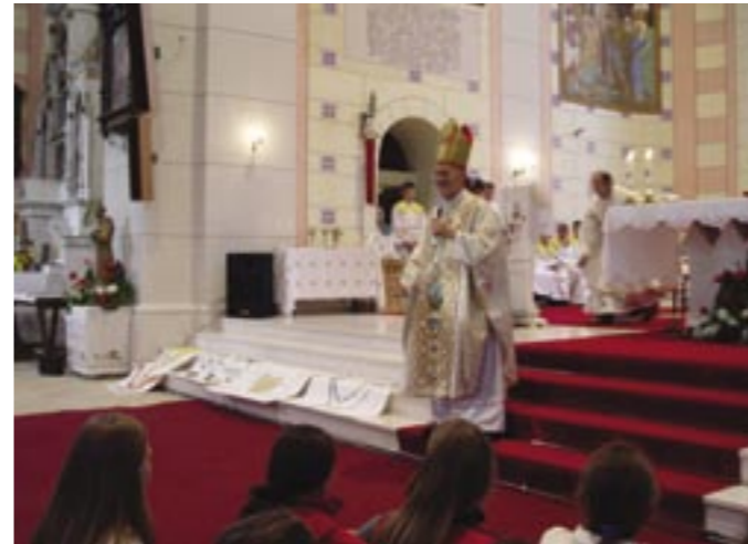
Biskup se obraća mladima