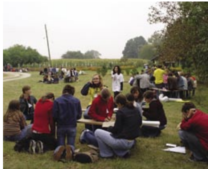
Rad u grupama

Nakon ručka su po interesnim grupama održane kreativne radionice i sportsko-rekreativne igre. Mladi su uz taj program ostali do 16,00 sati i tada je počela priprava za svetu misu. U 16,30 su autobusima preveženi do župne crkve gdje je u 17,00 sati slavljena sveta misa.