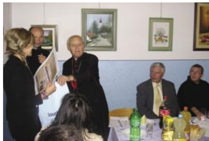
Predaja zahvalnica izvođačima