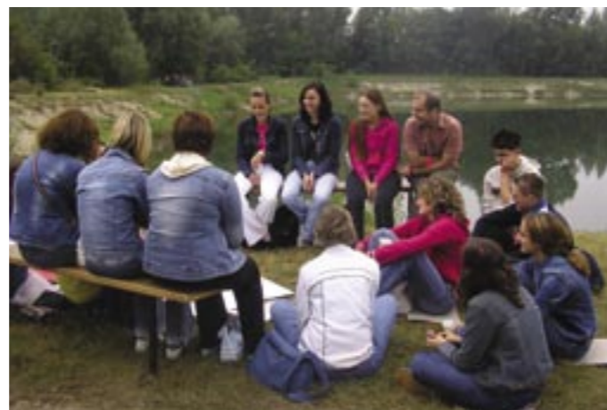
Rad u grupi