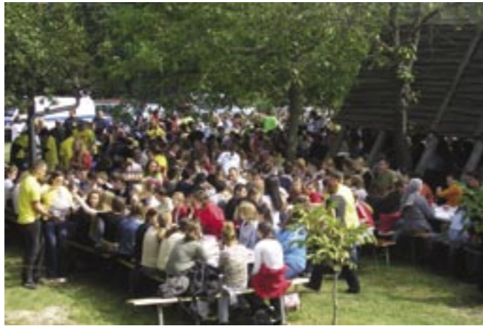
Ručak na Sekulinama