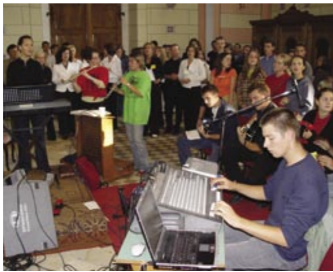
Raspjevana mladež na svetoj misi

Slijedio je ručak za sve prisutne na Sekulinama i za izvođače koji su došli pjevati na Marija Fest-u. Na zajedničkom ručku je bilo preko 400 osoba.