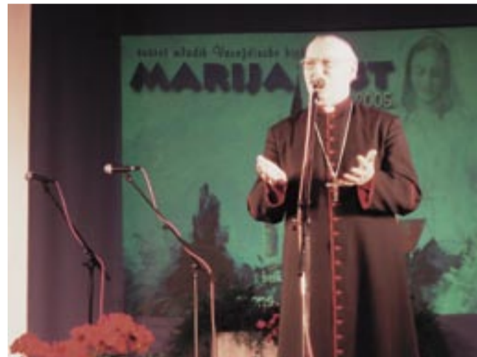
Festival je i ove godine otvorio mons. Marko Culej, varaždinski biskup

Glazbeni dio susreta je održan u športskoj dvorani Osnovne škole Molve u 20.00 sati. Pjesme su Marijanskog karaktera kao i cijeli susret sve se prtilo oko Marije - Majke Božje. Festival je otvorio mons. Marko Culej, Varaždinski biskup, a pozdravne govore su imali izaslanik provincijala Franjevaca konvntualaca fra Miljenko Hontić i župan Koprivničko-Križevačke županije g. Josip Friščić.