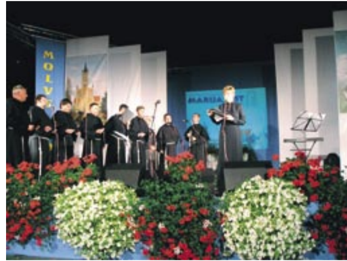
Gosti ovogodišnjeg Marija festa bili su članovi Noneta franjevaca konventualaca iz Zagreba

Pokrovitelji festivala su Hrvatska provincija franjevaca konventualaca sv. Jeronima, Svetište Majke Božje Molvarske i Općina Molve. Generalni medijski pokrovitelj je Hrvatski katolički radio, a sponzori su Privredna banka Zagreb i Laudato.