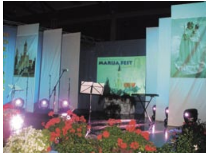
Izgled pozornice ovogodišnjeg Marija festa 2005.