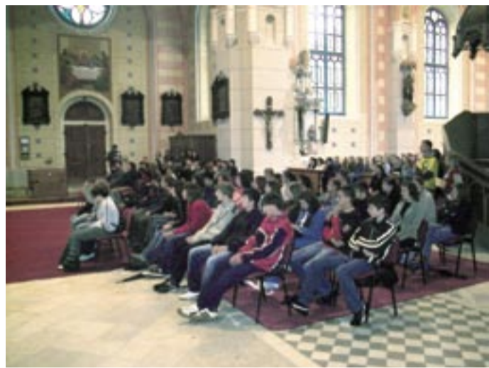
Mladi na euharistijskom slavlju u svetištu Majke Božje Molvarske

U Molvama, treću godinu za redom, održan je Susret mladih Varaždinske biskupije u nedjelju 18. rujna. Na susretu su sudjelovali mladi srednjih škola iz svih dijelova Varaždinske biskupije. Okupilo se oko 350 mladih srednjoškolaca. Organizatori susreta su Nacionalni centar udruge Vojske Bezgrešne i Povjerenstvo za Pastoral mladih Varaždinske biskupije. Susret je podijeljen na dva duhovna dijela: pastoralni i glazbeni. Nažalost ove godine je padala kiša i prvi dio susreta nismo mogli održati u Šekulinama, kako smo planirali nego smo ga održali u prostorijama Osnovne Škole Molve.