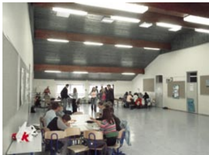
Radionice za mlade u Osnovnoj školi Molve

Nakon objeda vratili smo se u Molve, ponovno u prostorije Osnovne škole, gdje su po interesnim grupama održane kreativne radionice i sportsko rekreativne igre. Bilo je i plesa i rada i igre. Mladi su uz taj program ostali do 16.00 sati, a onda je počela priprava za svetu misu.