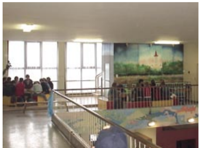
Radionice za mlade u Osnovnoj školi Molve

Pastoralni dio susreta je nastavljen u prostorijama Osnovne škole Molve. Na izlazu iz crkve mladi su podijeljeni u grupe po 15 srednjoškolaca u svakoj grupi koje su vodili animatori. Rasporedili su se po učionicama i školskim hodnicima. Po grupama su obrađivali zadanu temu i ciljeve. Rad po grupama je trajao do 13.00 sati, a onda su se ukrcali u autobuse i krenuli u Repaš na objed.