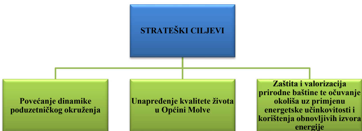
Grafički prikaz 1. Strateški ciljevi

Grafički prikaz predloženih strateških ciljeva i njihov opis slijedi u nastavku.