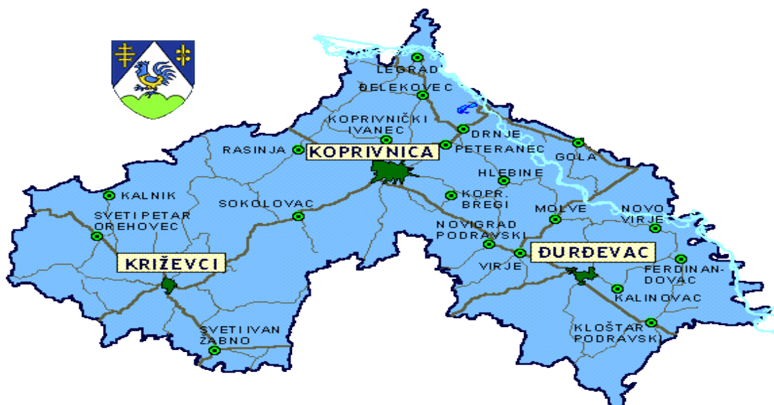
Slika 2. Geografski položaj Općine Molve